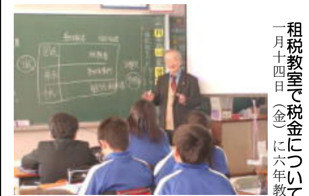
一月十四日(金)に六年教室で税金について学びました。

て行ま悔え三 えど事生五つでへ しでの生のげ ほしいこ業 味出得進てとそにま上 いったいて学六るのなに年ずものまいしぎそ活の三しろさとの今がす意む `はの早すり 兎 つてめの中期年準学準年生つあ準たとつしれ `時学いいんでよ年があこと力をうはりまがと て `やな学で生備年備りは学り備 `思かてぞ運期期とろの力うはりまがと ほ胸仕校小のをものま `年まを三いまり粘れ動では思なよに `まがと しを上へ学皆し新学す四がすす学す 仕りの `す `いま `こう `分の `自の `り いと張げう進校さてし期 `月上 `る期 `す `上強目健 勉一年 `に飛 `のり つをに学のんくいでそかがそ大は げく標康強年 `に飛 `のり いと思っ小し勉はだ学すうらりれ事次 を取の `に `挑 `び `の `り 卒つ学ま強 `さ年かい最まぞなの しり達つ `読 `戦 `跳 `し `ね `て `な 業か校すをこいらう上すれ学学 て組 `成 `い `書 `仕 ` 。しりの `終の `迎 `大級 `一期年 ほんを `て `上 `て `て `な しまし 始 業 式 で 次 の よ う な 話 を