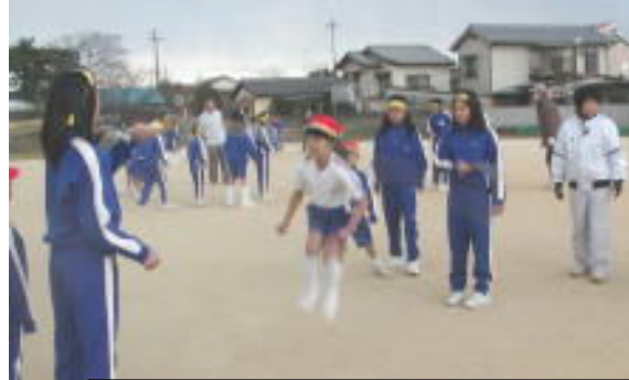
それ！イチ・ニ・サン がんばって

いきいきタイムでなわとびが始まる 1月からいきいきタイムでなわとびが始まりました。色別に分かれて長なわとびに挑戦しています。1月は、通算の回数、2月は連続の回数を競います。各チームとも力を合わせて練習に励んでいます。