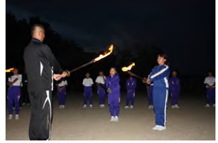
＜キャンプファイヤー＞