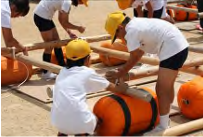
＜自分たちで作って「いかだ遊び」＞

6月17日（月）18日（火）の両日、屋島少年自然の家を利用して5年生が「集団宿泊学習」を行いました。二日間とも好天に恵まれ、予定通りの日程と内容で実施できました。この二日間、友だちや先生と寝食を共にしながら自分の頭と手を使って活動することを通して、一段とたくましくなった児童の姿を見ることができました。また今回は、次年度の統合を見据え、観音寺南小学校の5年生児童80名といっしょに活動しました。交流を通して、互いの良さだけでなく今後の課題も見えてきた二日間でした。