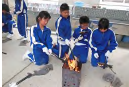
＜形として残った「焼き板づくり」＞