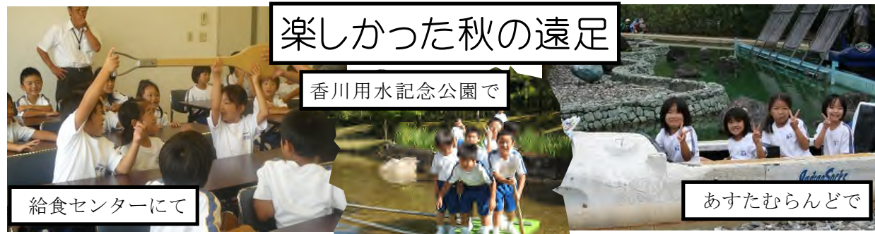
楽しかった秋の遠足