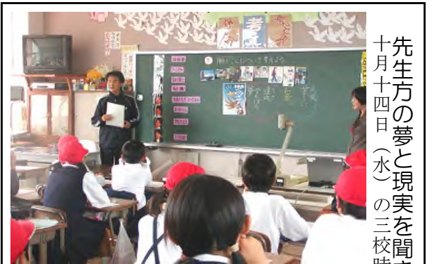
先生方の夢と現実を聞きました。 十月十四日(水)の三校時に

付近打なる動まなどじたかで強「し見勉 きづつ点点をし並を距後ら、の円たて強年 まくこをか通たび考離、輪異「と。いを生 しことたらし。方えに的投な時一球 とでく等てこを、すかげる に円さ距、の考公るらを距間 気にん離あ活え平こ同し離目勉 まにの