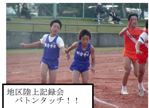
地区陸上記録会 バトンタッチ!!

すもりを現先 考大努そ夢もつ だ生活に六 の、聞実生身え切力のやのい「き方動にの年 と心くに方近まさす実希でて働まにの勉生 思に活つかなしにる現望、考くして強が わ残動いら三たつこにを将えこと、いを学 れつもて夢人。いと向持来ると。いを学 またあ話との てのけちに「に た先級