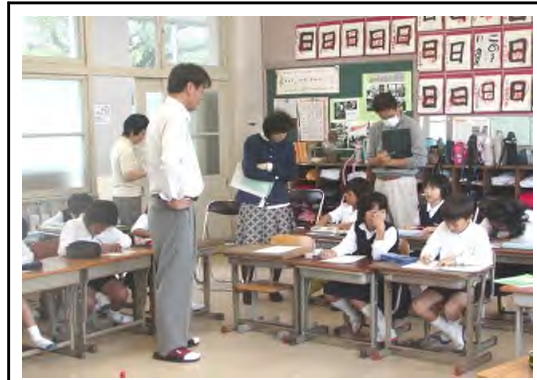
算数の勉強を見てもらったよ。 十月七日(水)の三校時に

付近打なる動まなどじたかで強「し見勉 きづつ点点をし並を距後ら、の円たて強年 まくこをか通たび考離、輪異「と。いを生 しことたらし。方えに的投な時一球 とでく等てこを、すかげる に円さ距、の考公るらを距間 気にん離あ活え平こ同し離目勉 まにの