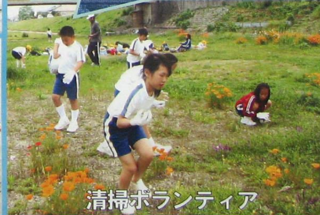
清掃ボランティア