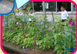
あさがおを育てたよ