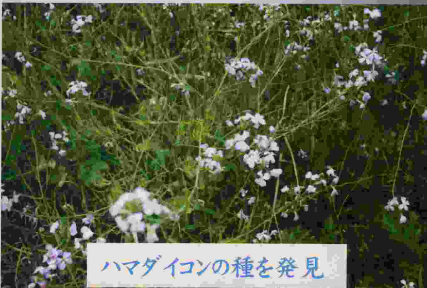
ハマダイコンの種を発見