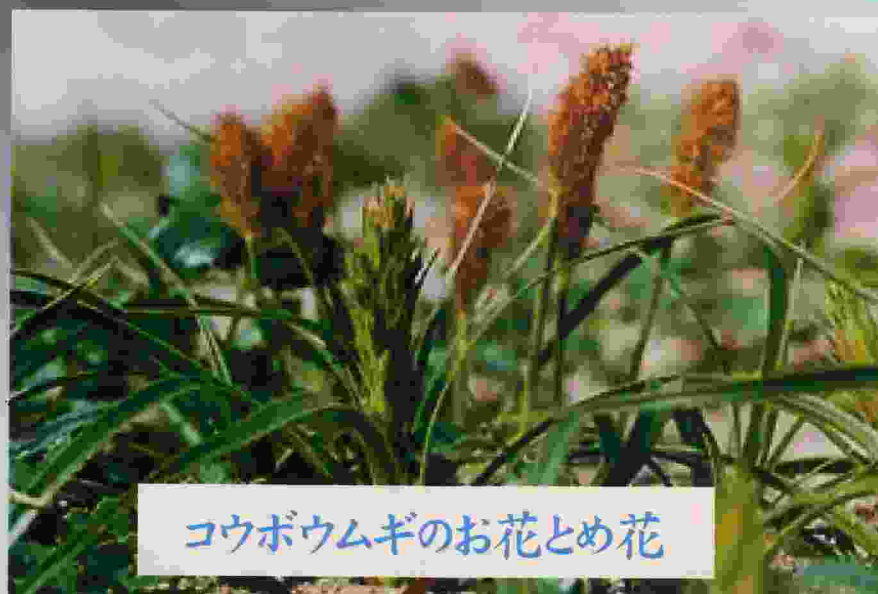
コウボウムギのお花とめ花